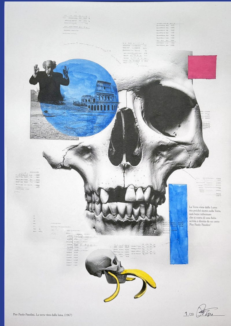
Pier Paolo Pasolini