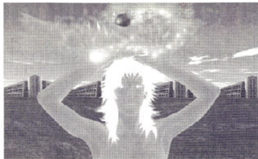
Una delle opere di Pino Oliva esposte a Bombay nella mostra «Città animate e anime cittadine» allestite nella Kamalanayan Bajaj Art Gallery di Bombay

cazione artistica confrontandosi con il linguaggio internazionale. Ha partecipato a diverse rassegne d'arte in Italia e, in particolare a Roma esponendo in una mostra personale nell'aprile 2002 alla Domus Sessoriana, dal titolo "interno-esterno" ed in una collettiva a gennaio 2003 dal titolo "Gates - Passaggi d'arte contemporanea". A gennaio 2005 ha partecipato all'evento espositivo tenutosi nel